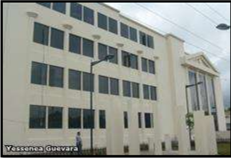
Palacio de Justicia