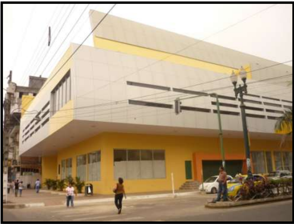
Quevedo Center Shopping