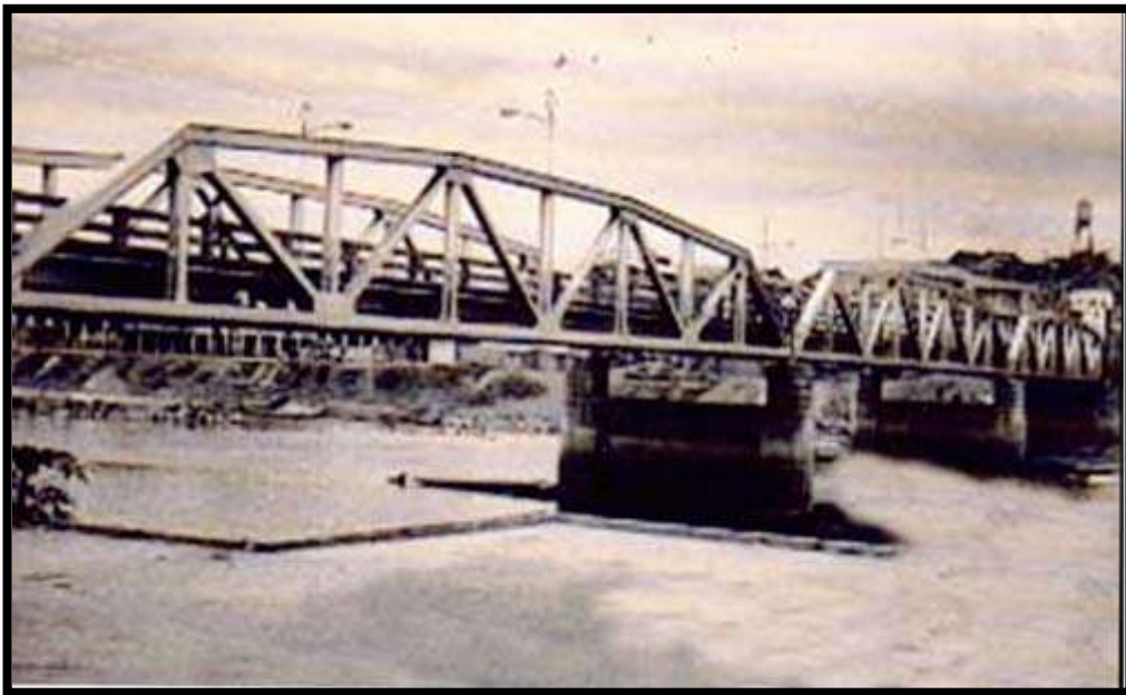
Puente Velasco Ibarra. Año 1952