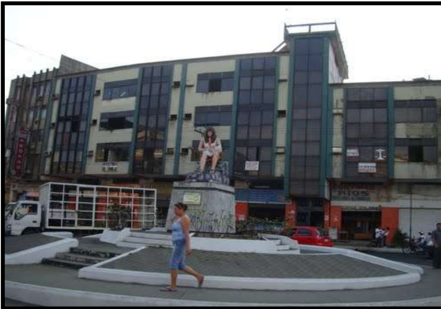
Parque de la Madre