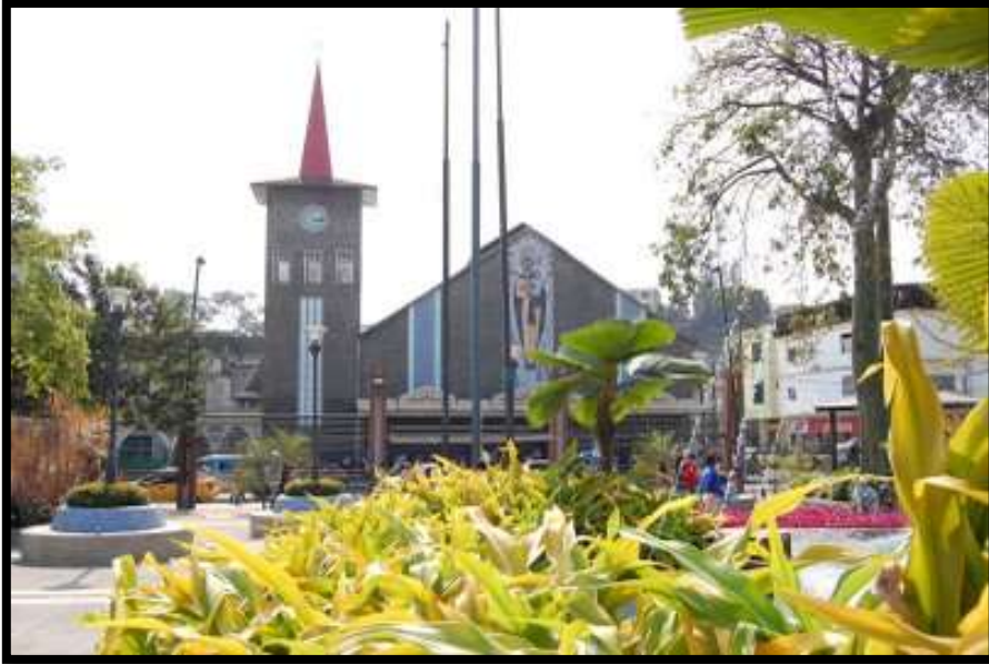
Iglesia San Jose