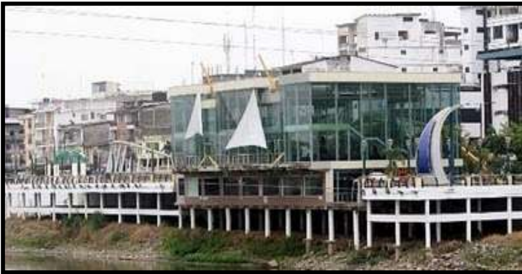
El nacimiento de Quevedo. En la foto se observa el malecón de la urbe.