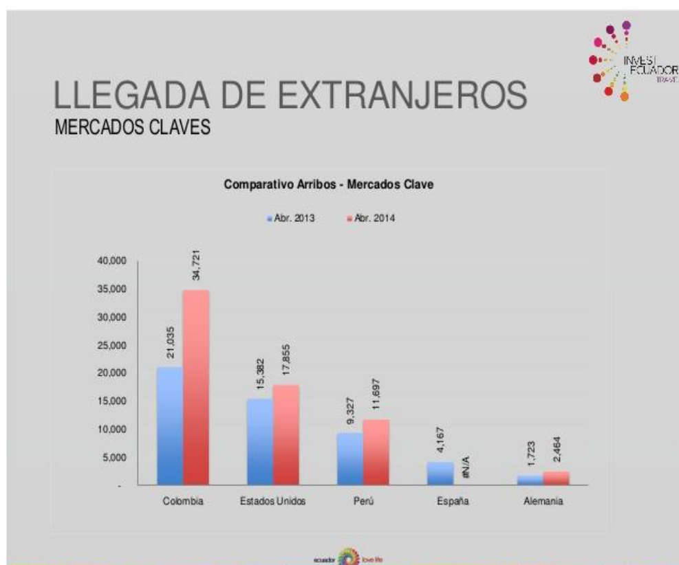
Gráfico 1: Comparativo de Arribos – Mercados Clave