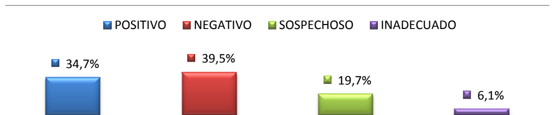
Gráfico 6-3: Resultados de las PAAF en los casos estudiados

En las pruebas tiroideas, el nivel de la hormona reportó eutiroidismo en el 70.1% de los casos. Se informó de hipertiroidismo en el 23.1% de los pacientes (Tabla 6-4). En el estudio de Russell, (2004) encuentra también una baja incidencia de pacientes con alteraciones de las hormonas tiroideas y generalmente los hallazgos anormales corresponden a hipertiroidismo en pacientes con cáncer de tiroides.