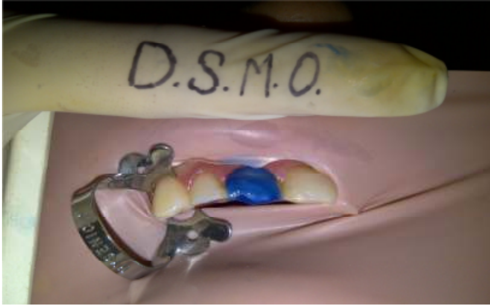
FOTO 5. Aplicación de ácido grabador.

Fuente: Clínica de Internado de la Facultad Piloto de Odontología.