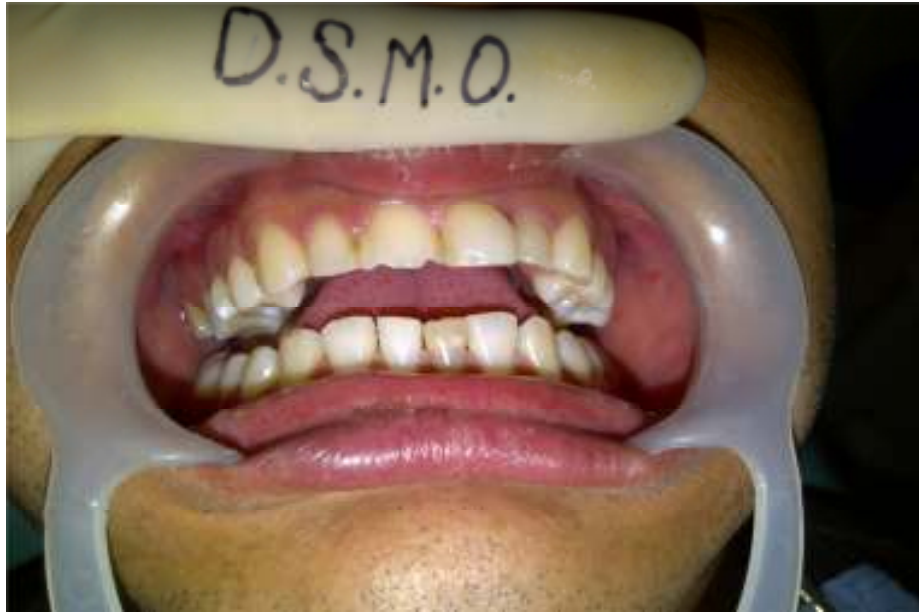
FOTO 2. Presentación del caso.

Fuente: Clínica de Internado de la Facultad Piloto de Odontología.