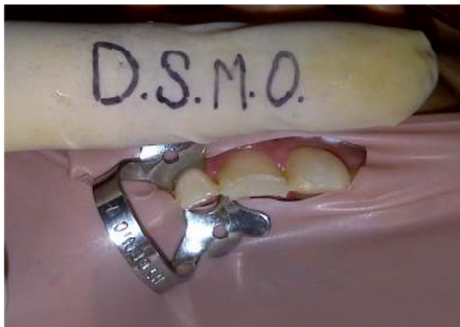
FOTO 8. Obturación con aislamiento absoluto.

Fuente: Clínica de Internado de la Facultad Piloto de Odontología. Universidad de Guayaquil.