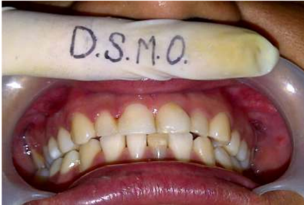
FOTO 9. Restauración terminada, pulida y abrigantada con abre boca.