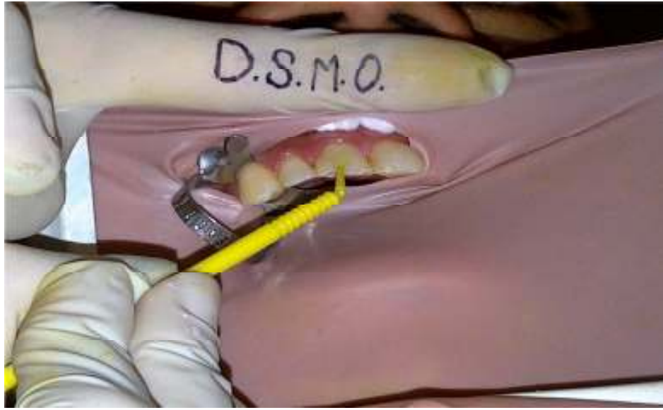
FOTO 6. Sistema adhesivo con aislamiento absoluto.