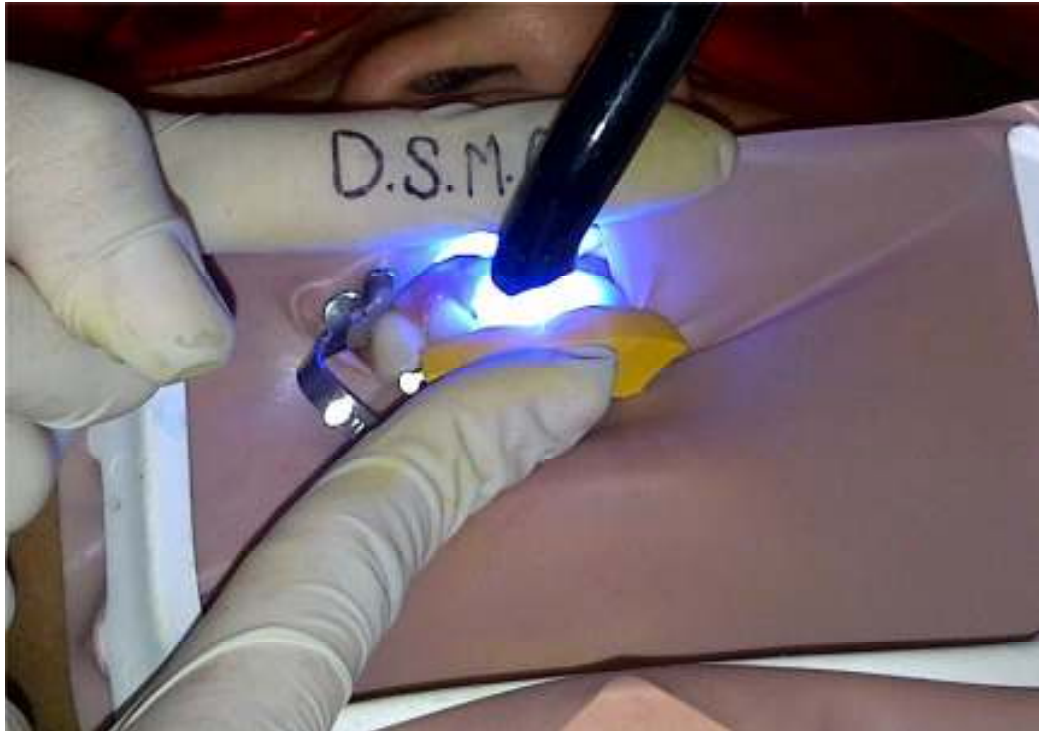
FOTO 7. Conformación de la pared palatina.

Fuente: Clínica de Internado de la Facultad Piloto de Odontología. Universidad de Guayaquil.